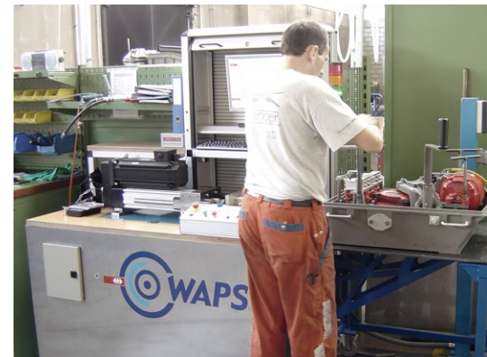
Sistema di controllo degli scambi